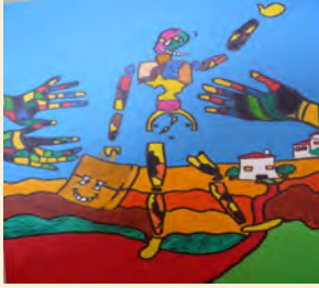
FUNDACION TUTELAR Y ASISTENCIA PERSONAL