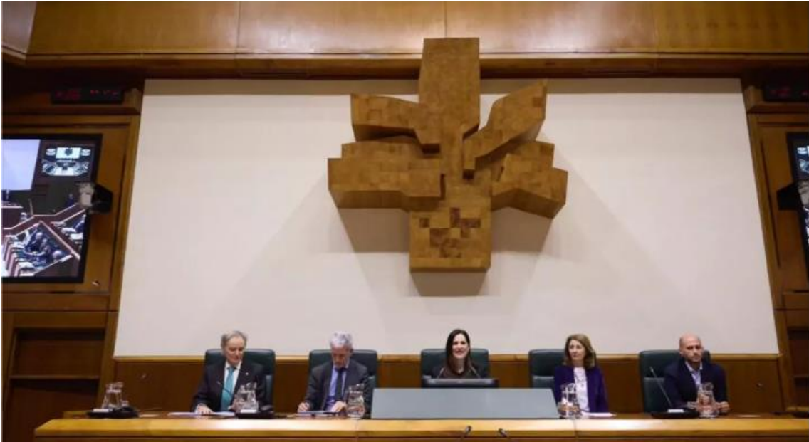
Imagen de la jornada 'Dos años de vigencia de la Ley 8/2021: contextualización jurídica y social'

El Parlamento vasco acogió este martes la jornada 'Dos años de vigencia de la Ley 8/2021: contextualización jurídica y social', organizada por el Foro Aequitas de Discapacidad de Euskadi y Eusko Legebiltzarra para analizar la aplicación práctica de la nueva normativa sobre discapacidad.